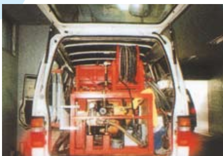
貯水槽用ジェットブランチャー