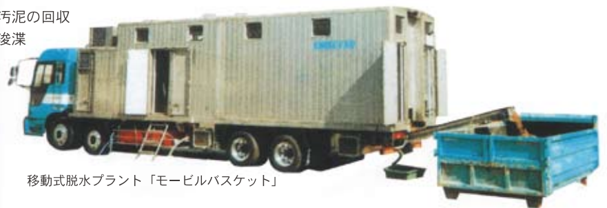
移動式脱水プラント「モービルバスケット」