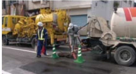
高圧洗浄車による清掃状況