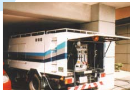
排水用高压洗浄車